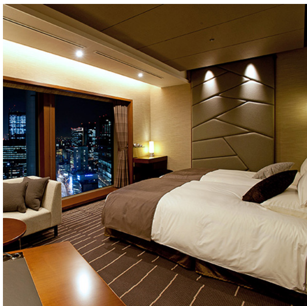
ホテルグランヴィア大阪 「グランヴィアツイン」

ホテルヴィスキオ大阪の「平日限定&トリオがお得！39（サンキュー）プラン」は、仲良しの3人旅やご家族旅行などにおすすめの、3名様1室9,000円（お一人様3,000円）の均一価格です。さらにプラン特典として、ホテル1階のイタリアンキッチン「ヴェルデ カッサ」ランチbuffetの「3名様でのご利用で1名無料券」をプレゼントいたします。